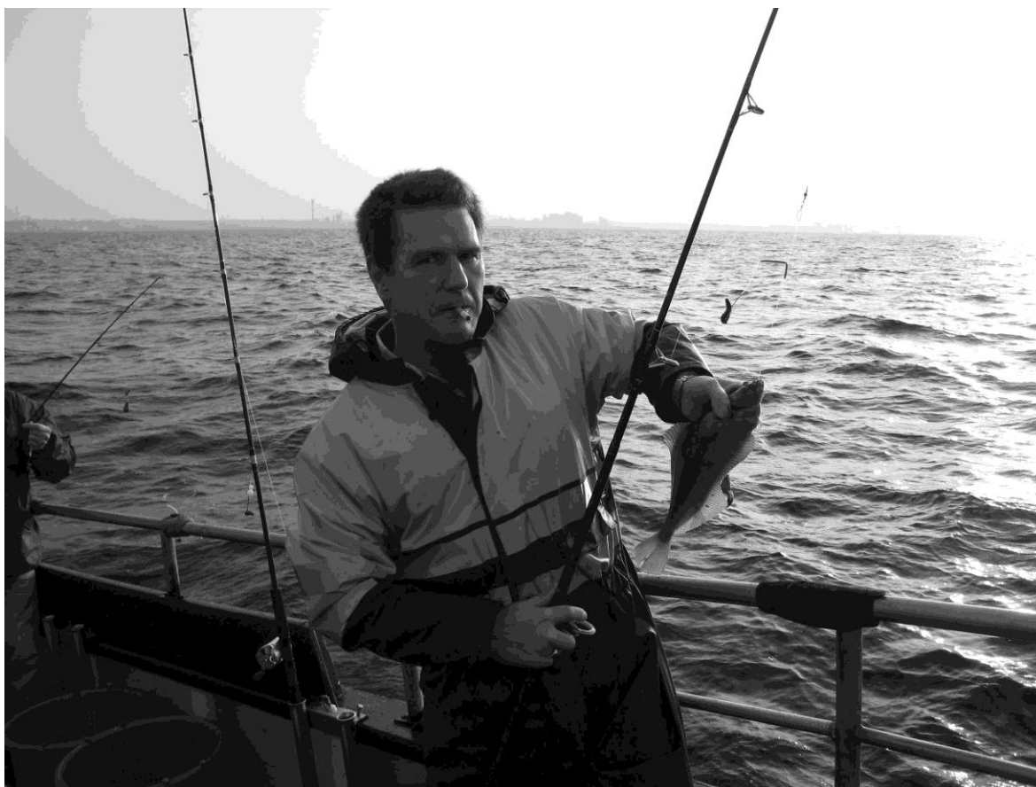
Per med en flad, dog fra fladfisketuren

Jeg fik dem begge på samme hug, så det var en tung en at få op, Derudover de flade fik jeg en del fjæsing.