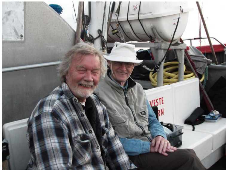
DE 2 GAMLE HVILER SIG PÅ AFTENTUREN