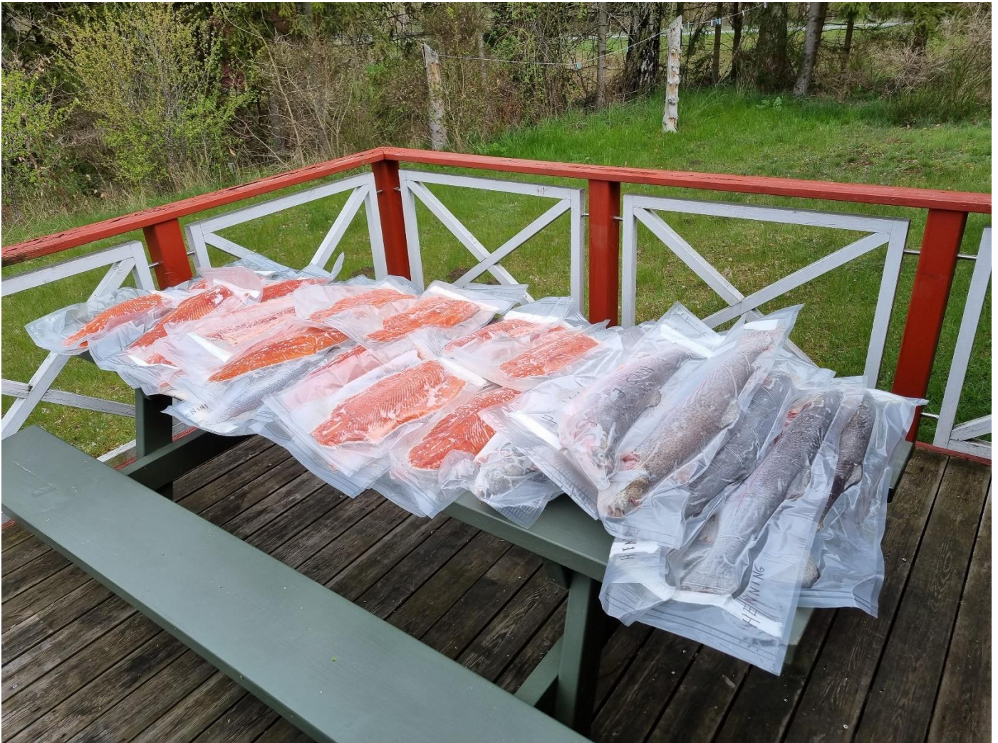
Fangsten er vacuum pakket og nedfrosset