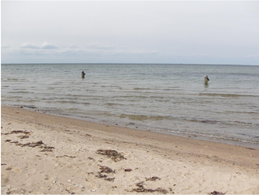
PÅ JAGT EFTER HAVØRREDEN