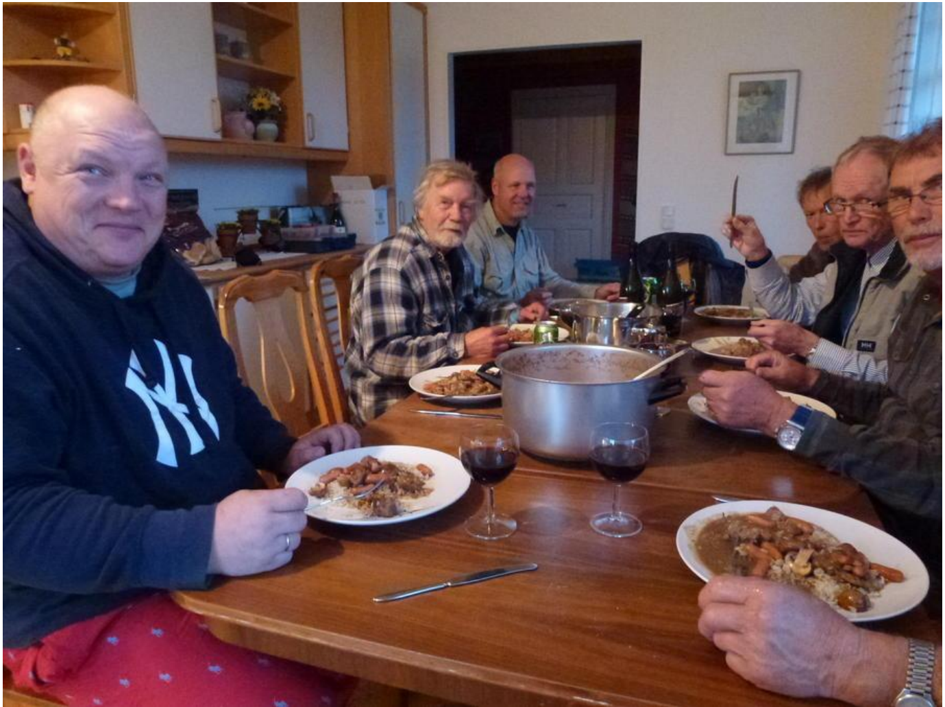
TRÆTTE MEN GLADE VED BASALT (LAGAN)