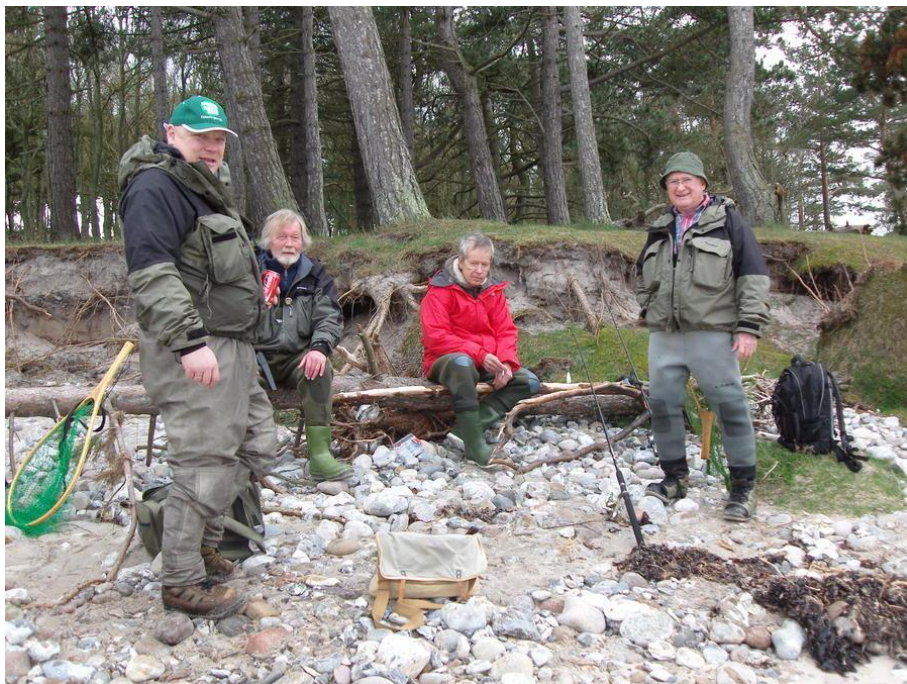
PUSTER UD EFTER FISKERIET