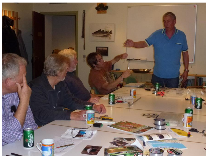
HAR I FORSTÅET DET?