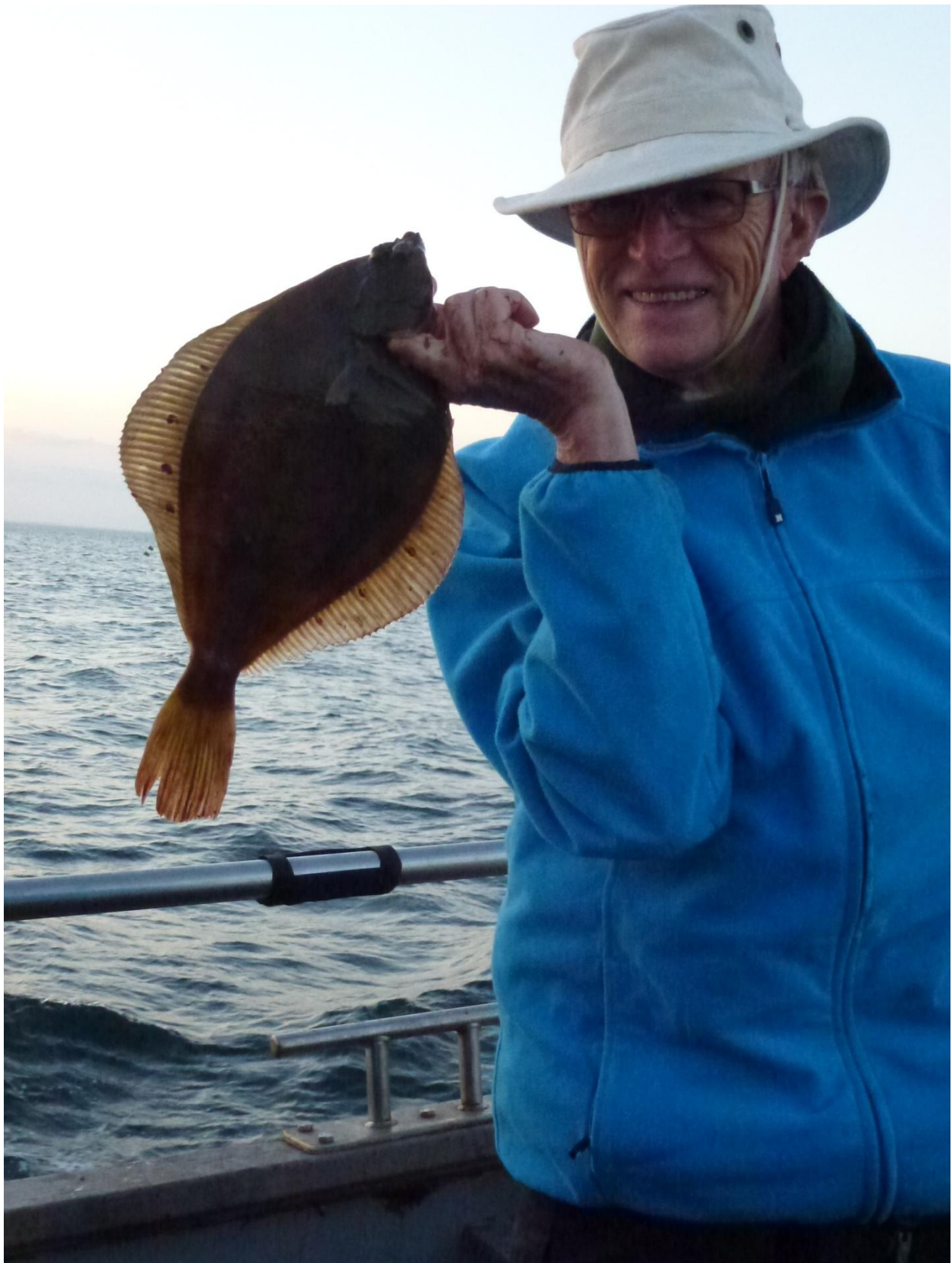
BENT MED SPÆTTE FANGET PÅ PIRK