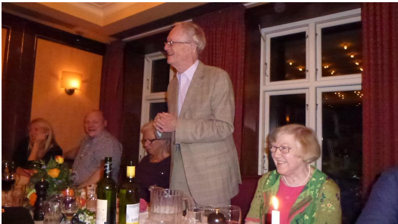
Visdomsord ved jubilæet