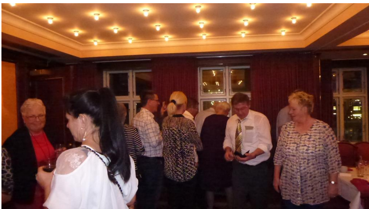
Forventningsfulde gæster ved Jubilæumsmiddagen