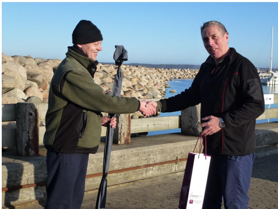
Vinder på nytårsturen 2012