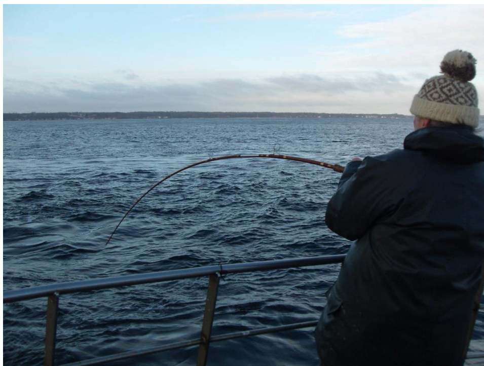
Bulefiskeri vinter 2013