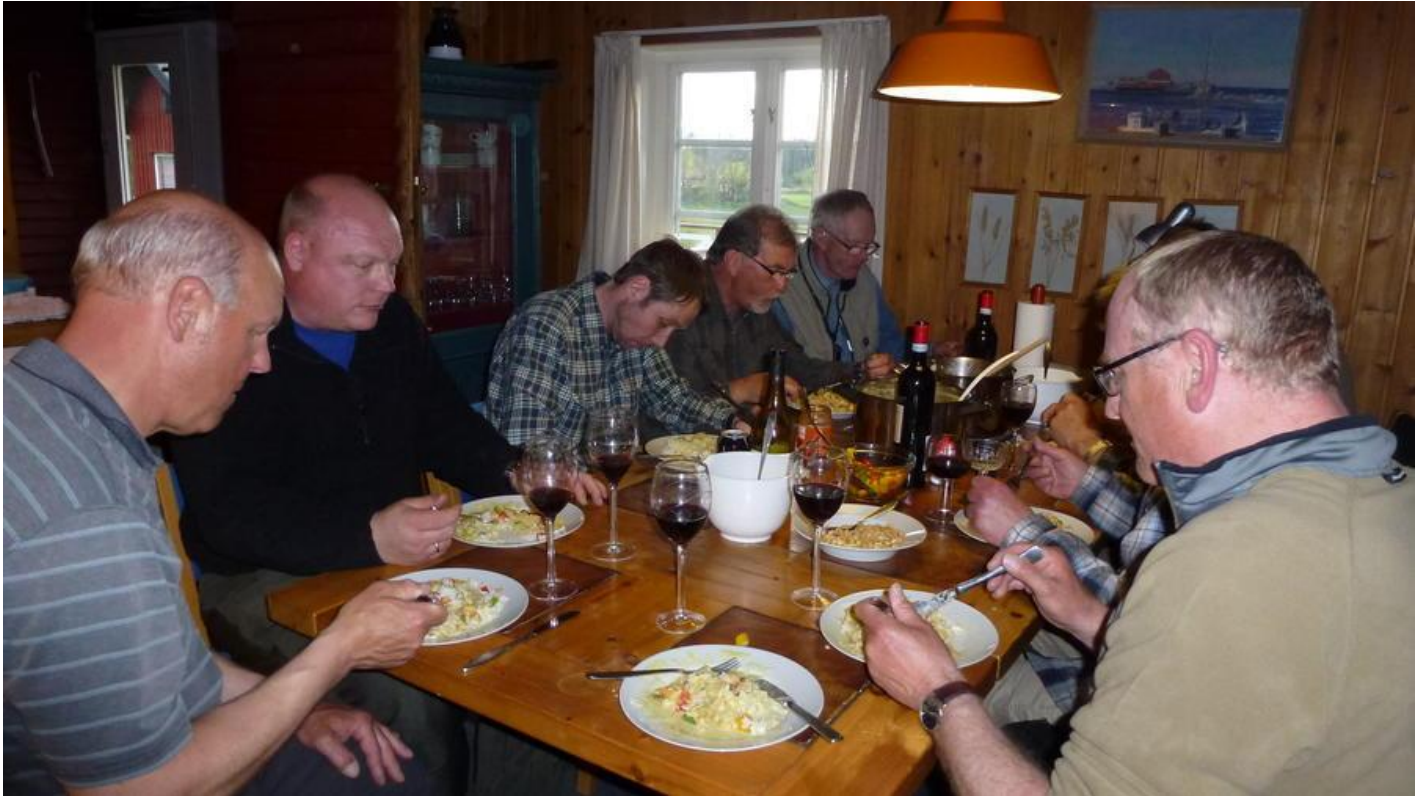
MAD-TAVSHED VED HARASJÖMÄLA