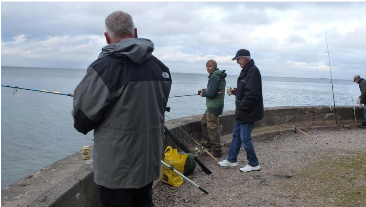
EN KOLD AFTEN VED STRANDMØLLEN

Vi skulle måske have gået efter fladfisk for ved siden af os stod en far og søn med 3 stænger og hev den ene flade efter den anden på land. Pæne skrubber og rødspætter samt enkelte isinger.