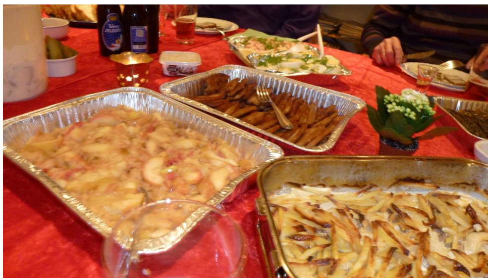
Lækkerier fra julefrokosten

Når vi har opnået nævnte medlemsfordele vil I blive orienteret.