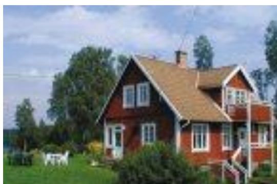
fra Huset i Knäred

Egenbetaling vil blive 200-250 kr. afhængig af antallet af deltagere og prisen på huset.