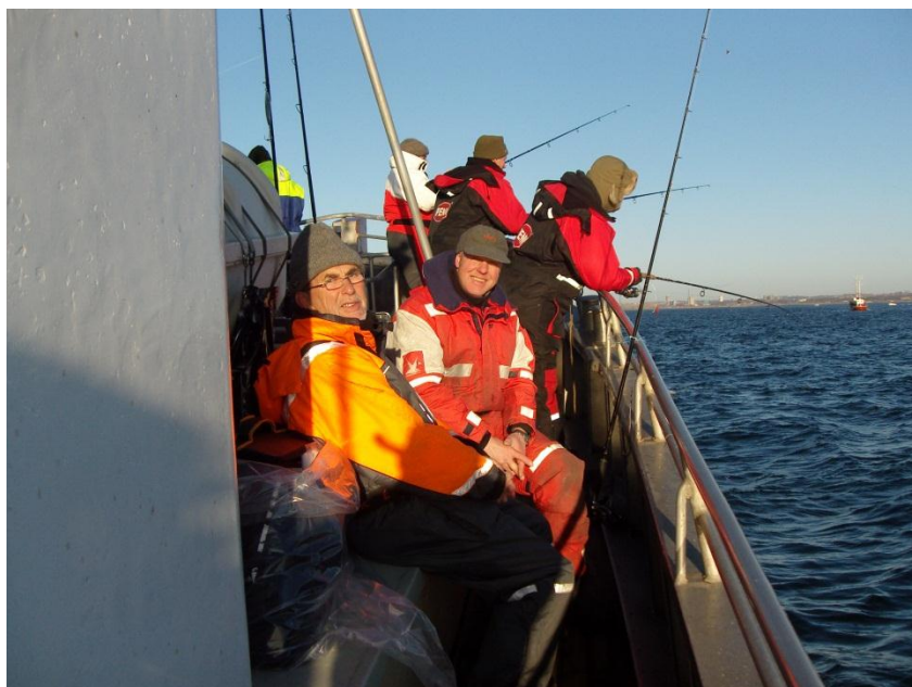
Forventnings fulde "Neptunere"

Førstepræmien på en lækker 9 fod Grays spinnestang doneret af