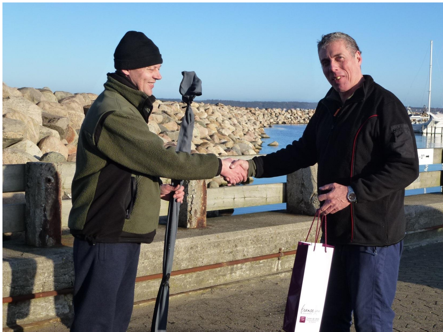
Vinderen på Nytårsturen