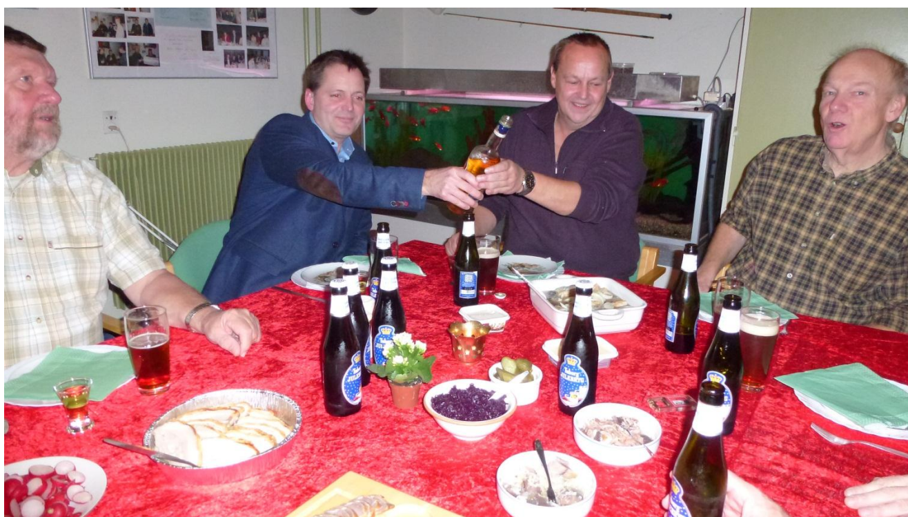
Megen glæde og stemning ved julefrokosten