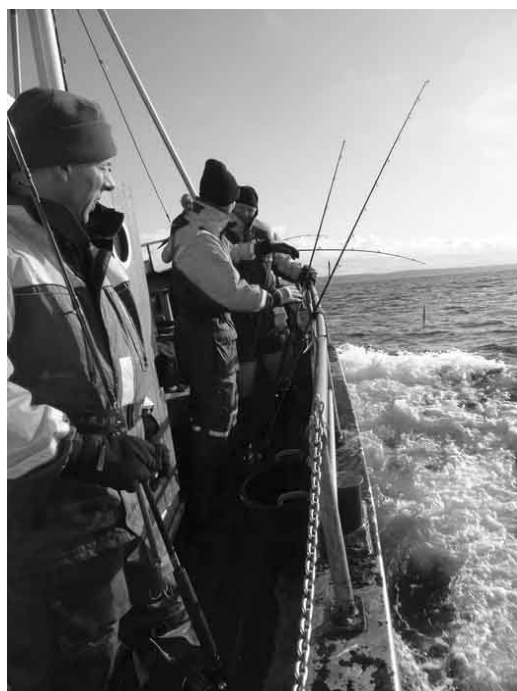
VEJRET VAR GODT I MARTS