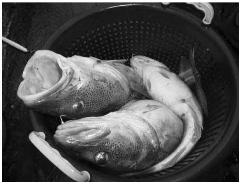
FLOTTE FEBRUAR TORSK