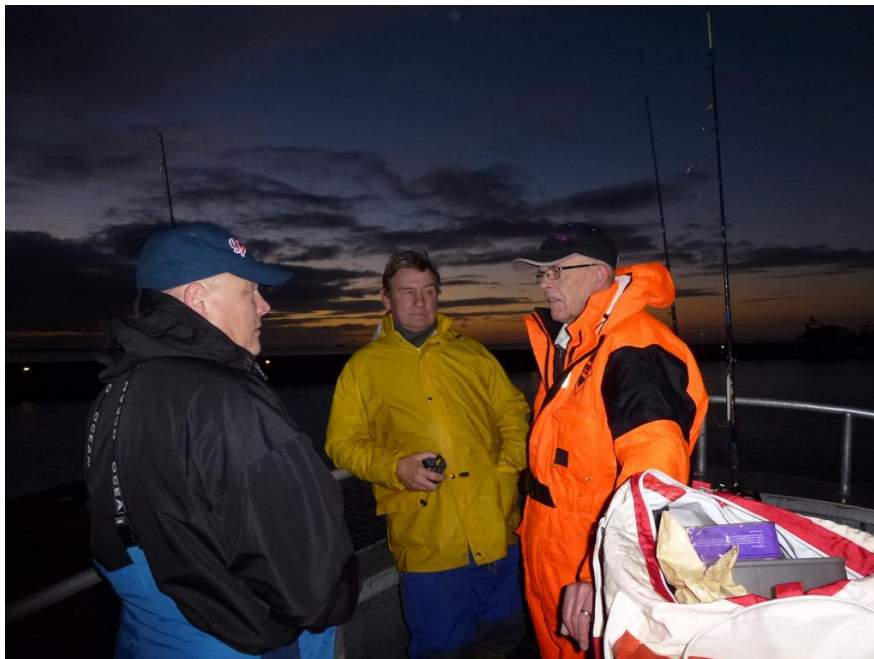
Nu er det sent på året på Øresund