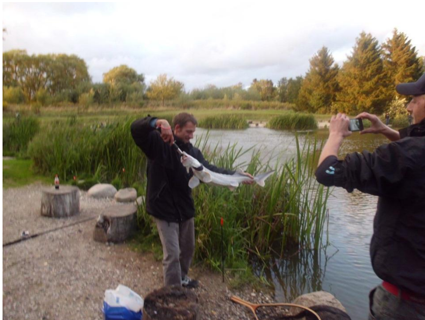
Stør fra Poppelsøen

Beviset findes på billedet. Dog skal det nævnes at støren skal landes med hånd eller i net og ikke som på billedet med en Boga Grip.