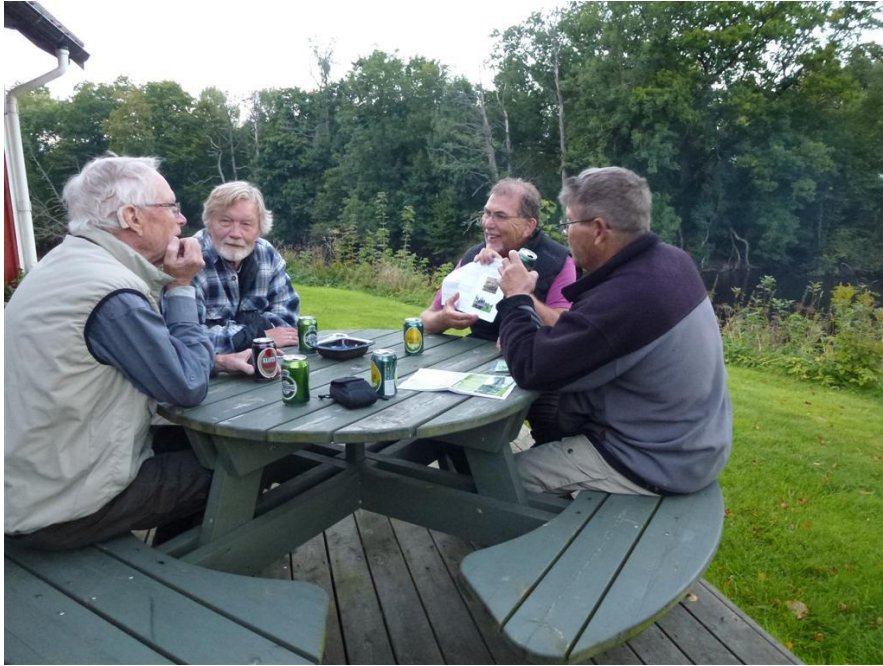
Vi hyggede os dog på turen