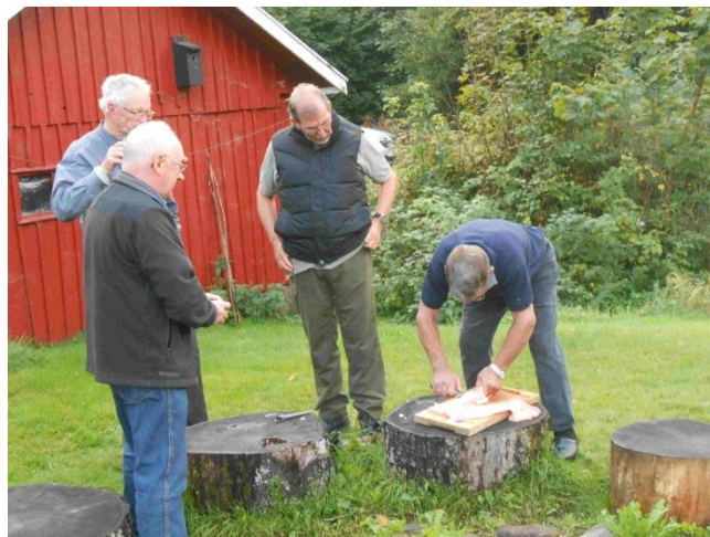
ENESTE FANGST I ÅR FILLETERES

Egenbetaling vil blive 200-250 kr. afhængig af antallet af deltagere og prisen på huset.