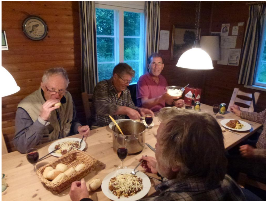
Kylling i Karry i Knäred