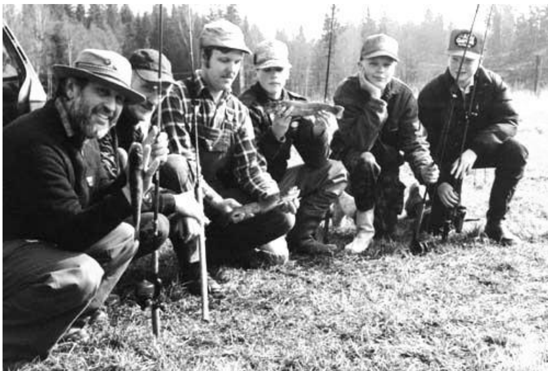
Nogle gamle billeder fra arkivet