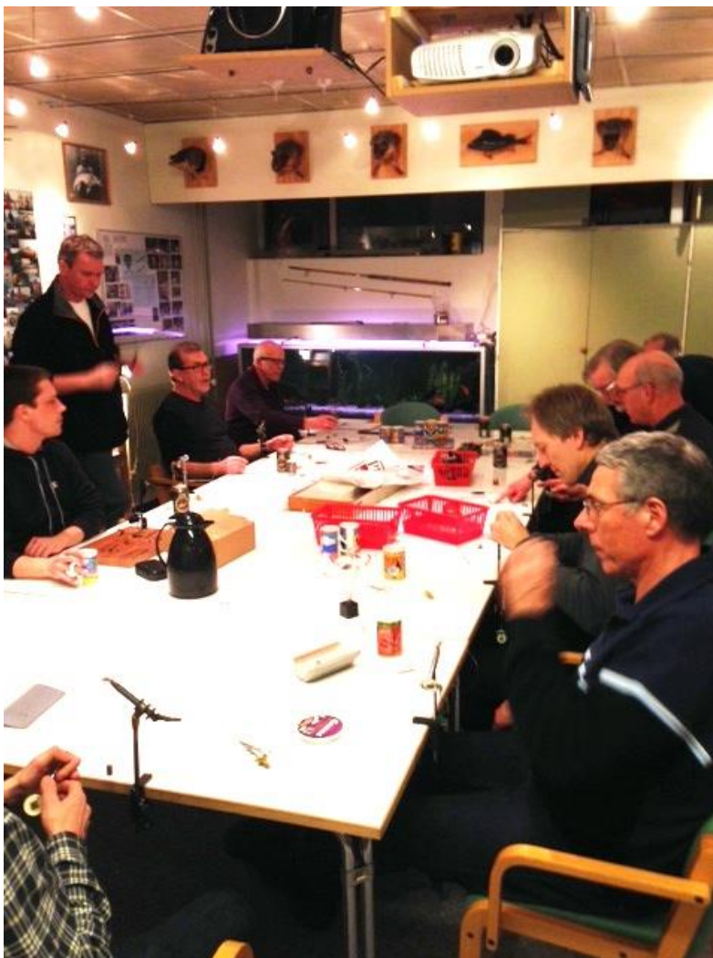
DYYYB KONCENTRATION VED FLUEBINDINGEN