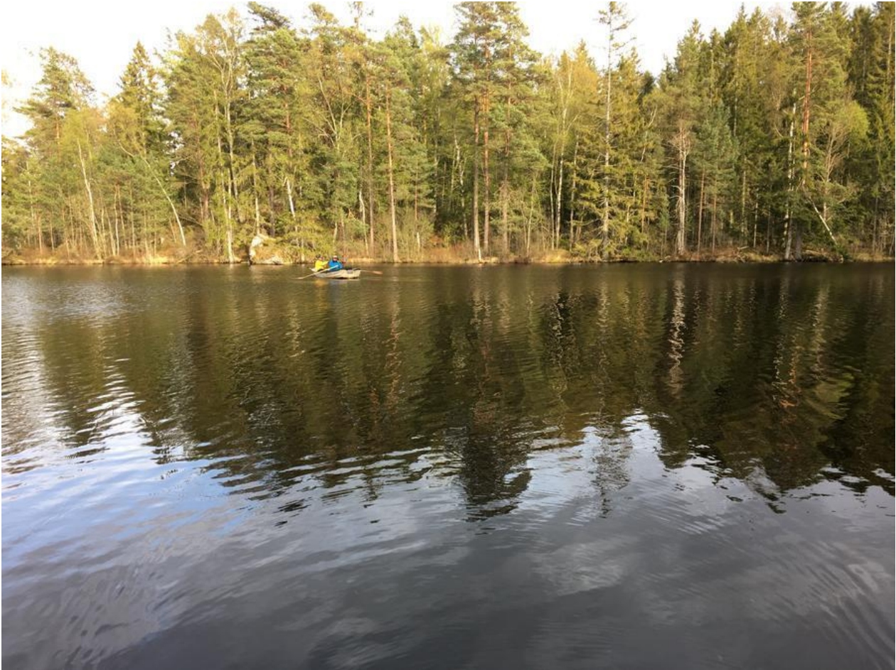
IDYL I HARASJÖMÅLA