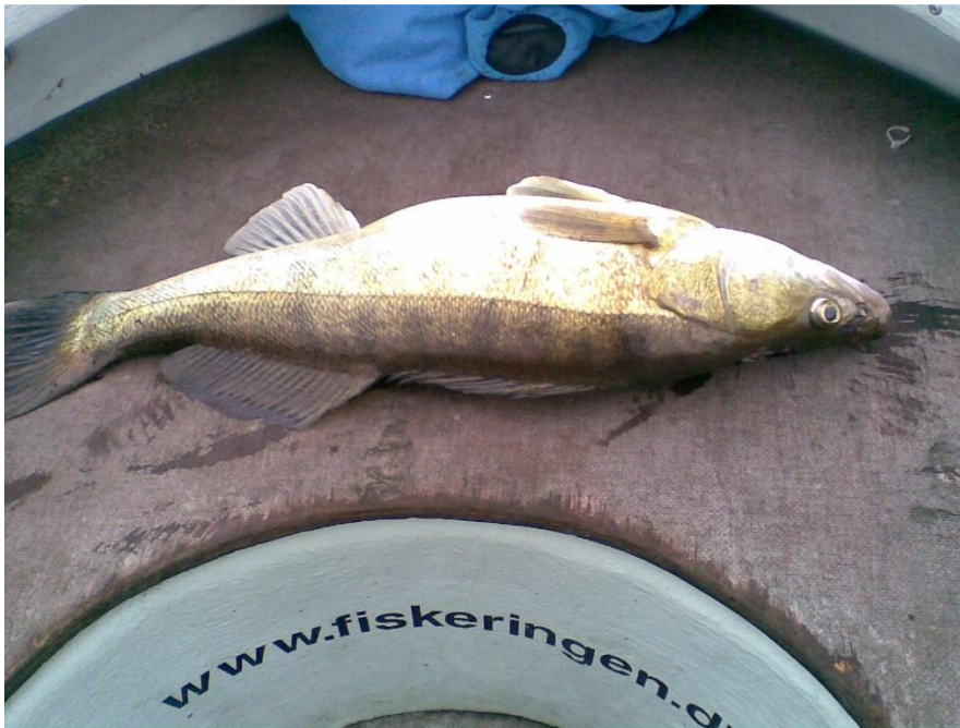
BENTS SANDART PÅ 3,6 KG, 71 CM