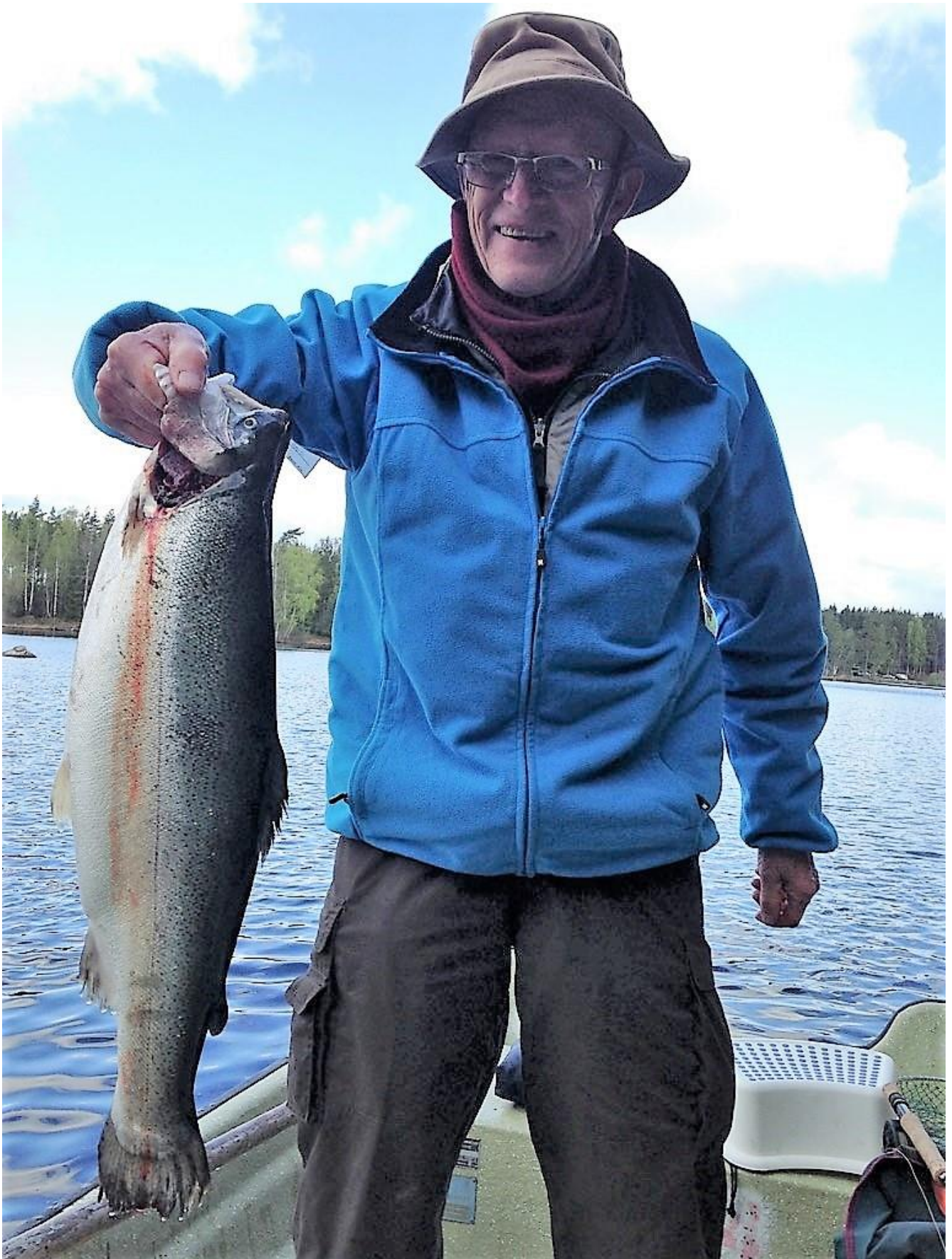
Bent med ørred fra Harasjömåla 2018