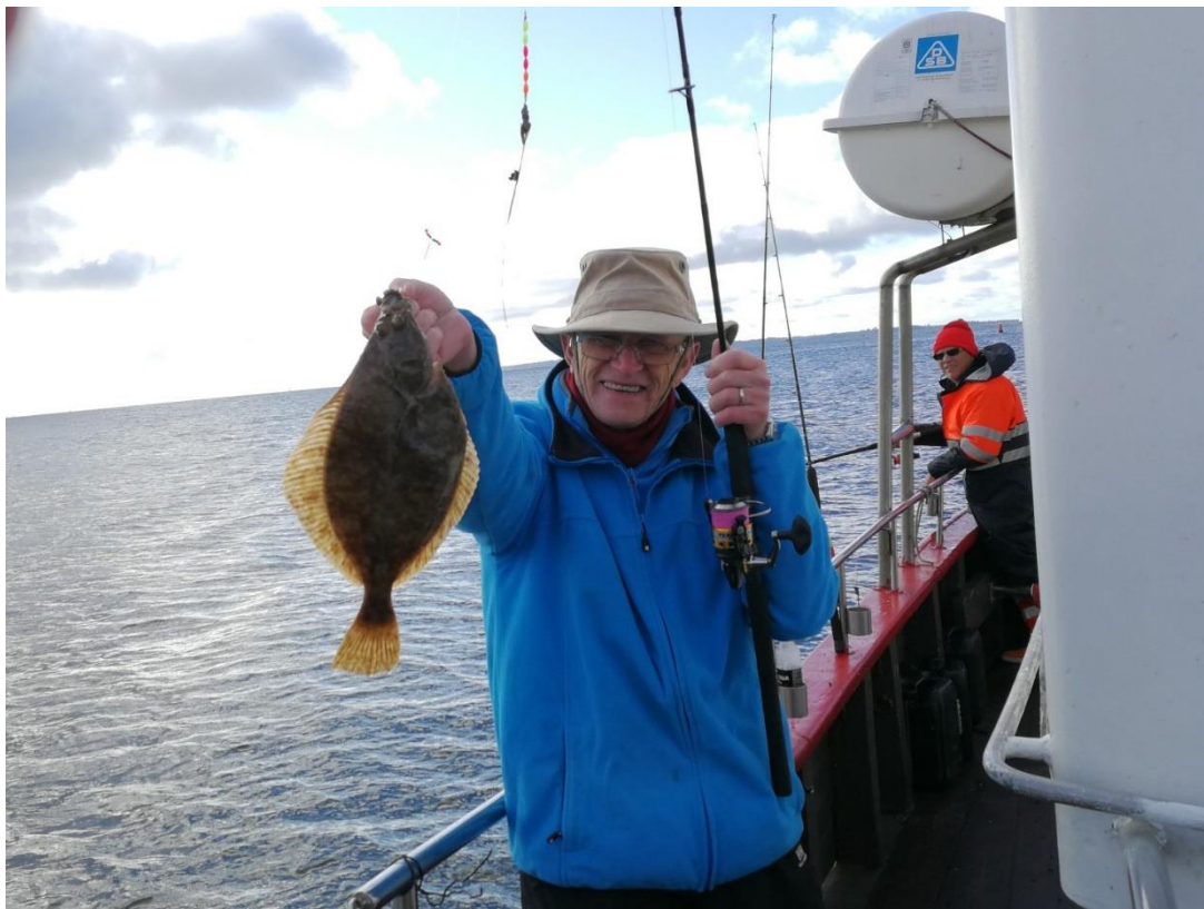
BENT PÅ FLADFISKETUR

Ret til ændringer i det trykte program forbeholdes.