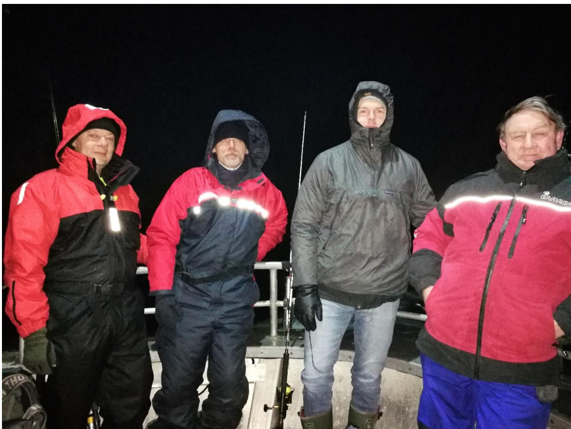
Morgenfriske fyre på vej til nytårsturen