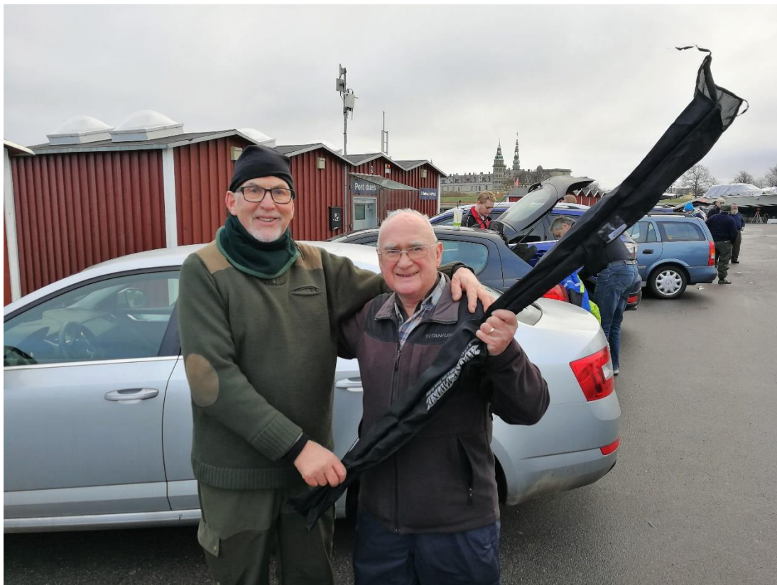
VINDEREN AF NYTÅRS PRÆMIEN