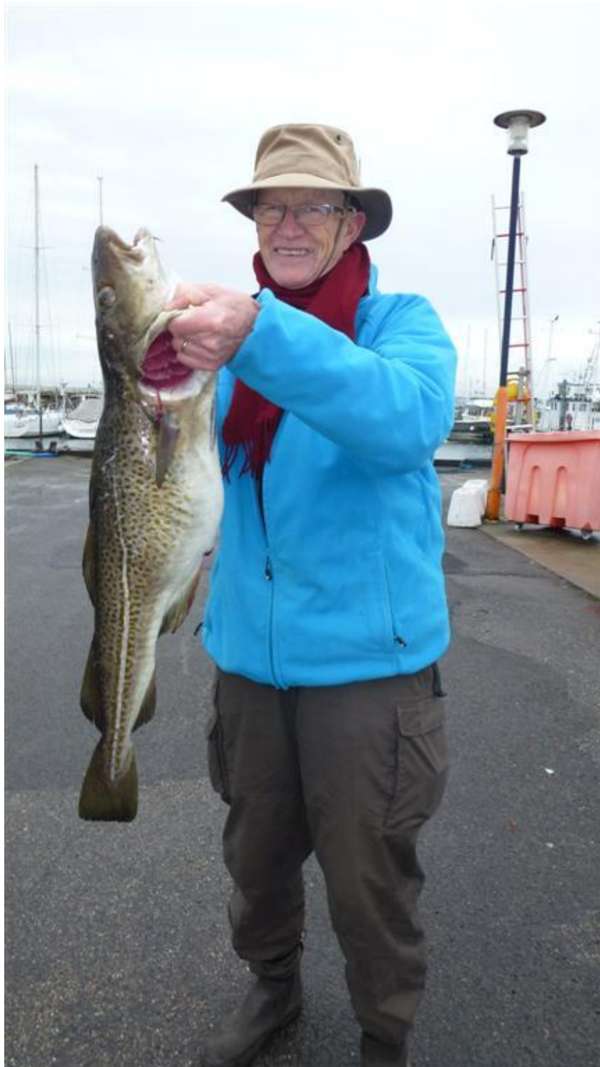
Bent med torsk fra Øresunds tur