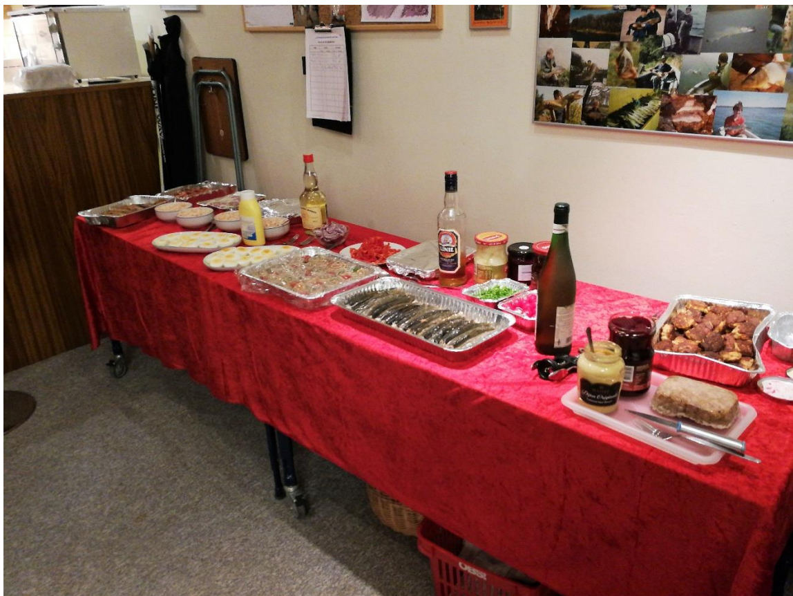
Det flotte julebord