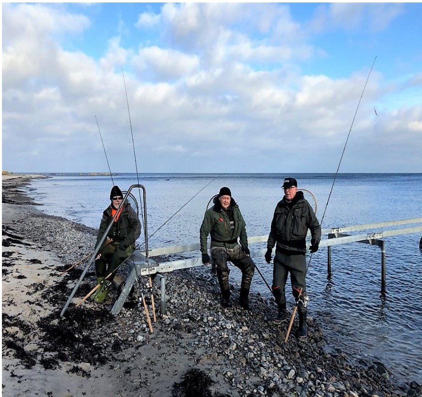
Tre af de barske gutter på Bornholm