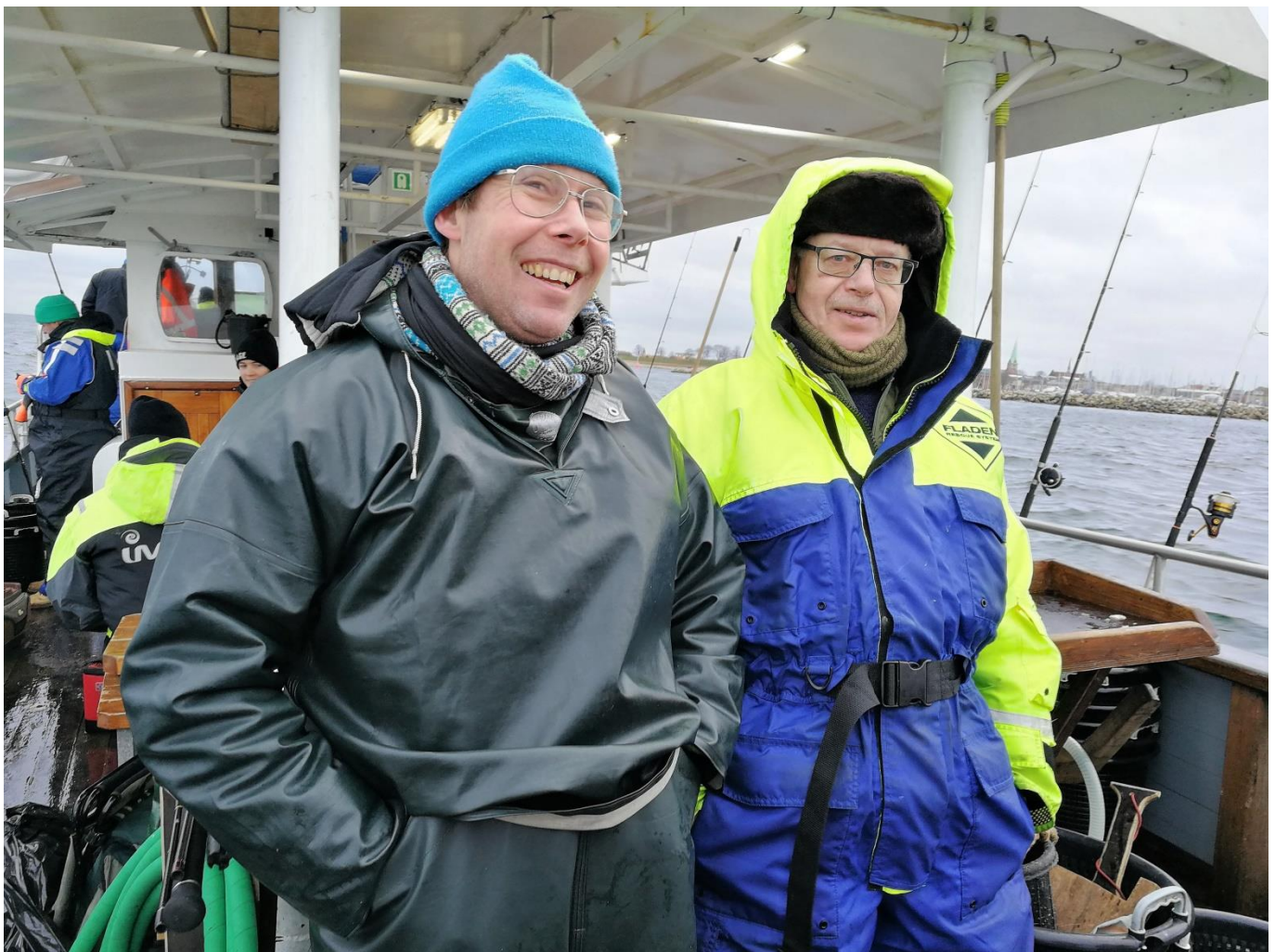
Lille pause i fiskeriet