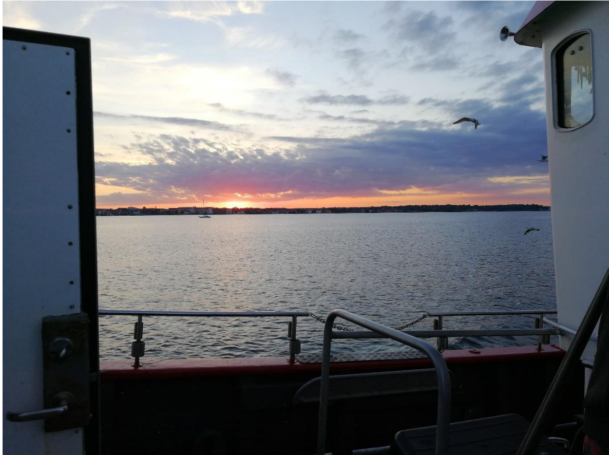
Fyrholm og den smukke solnedgang over sundet