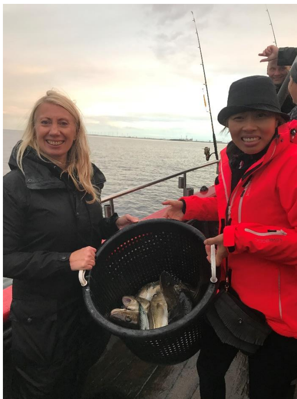
To søde fiskedamer