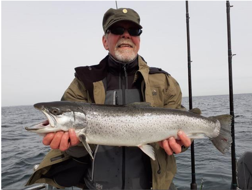
Havørred 2,6 kg fra Øresund