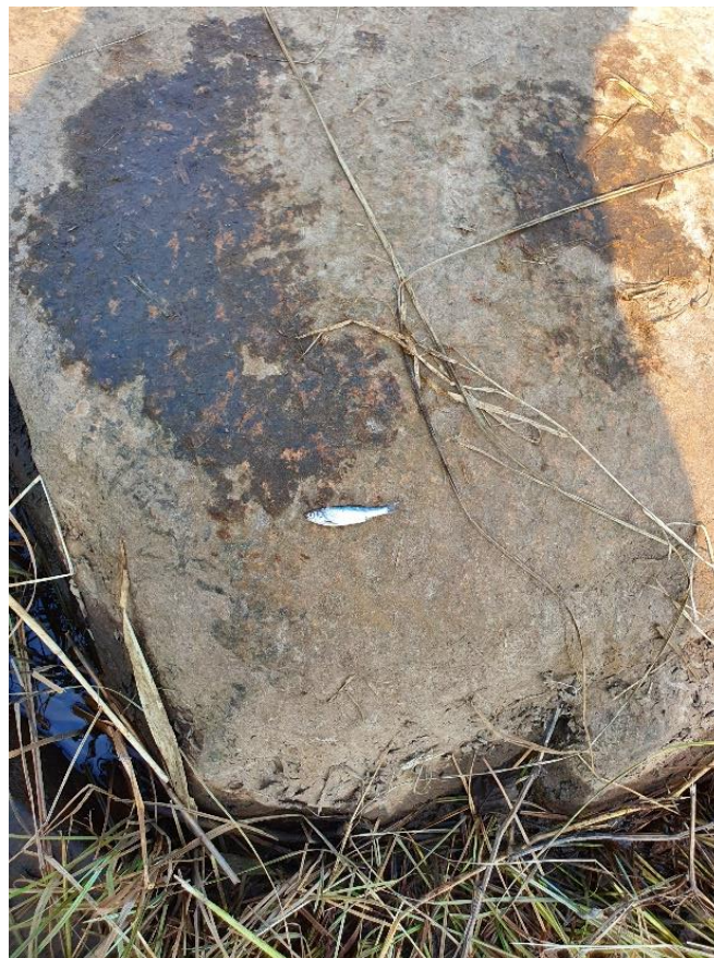
Michaels skalle fra Lagan

Ret til ændringer i det trykte program forbeholdes.