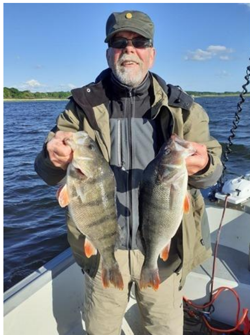
Abborrer 1,330 kg og 1,510 kg