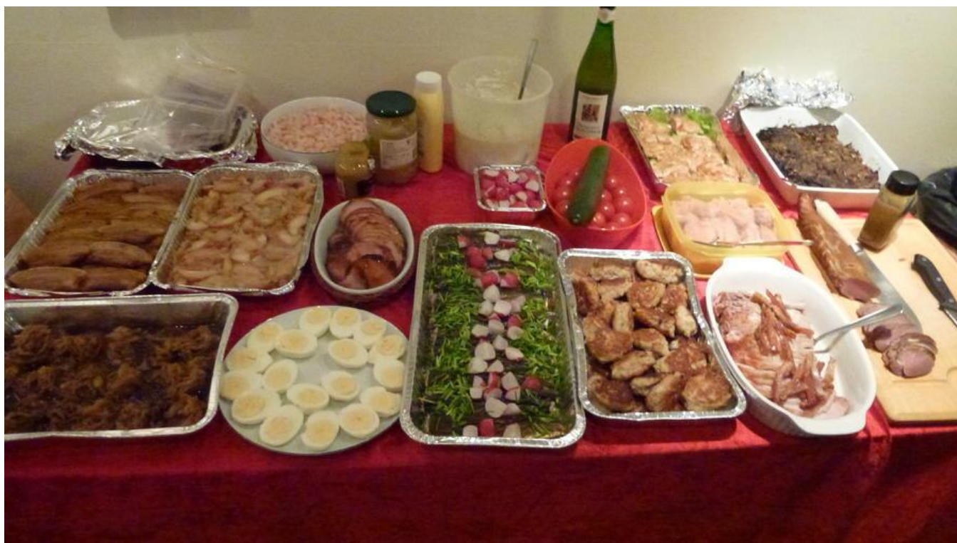
Nogle af godterne!