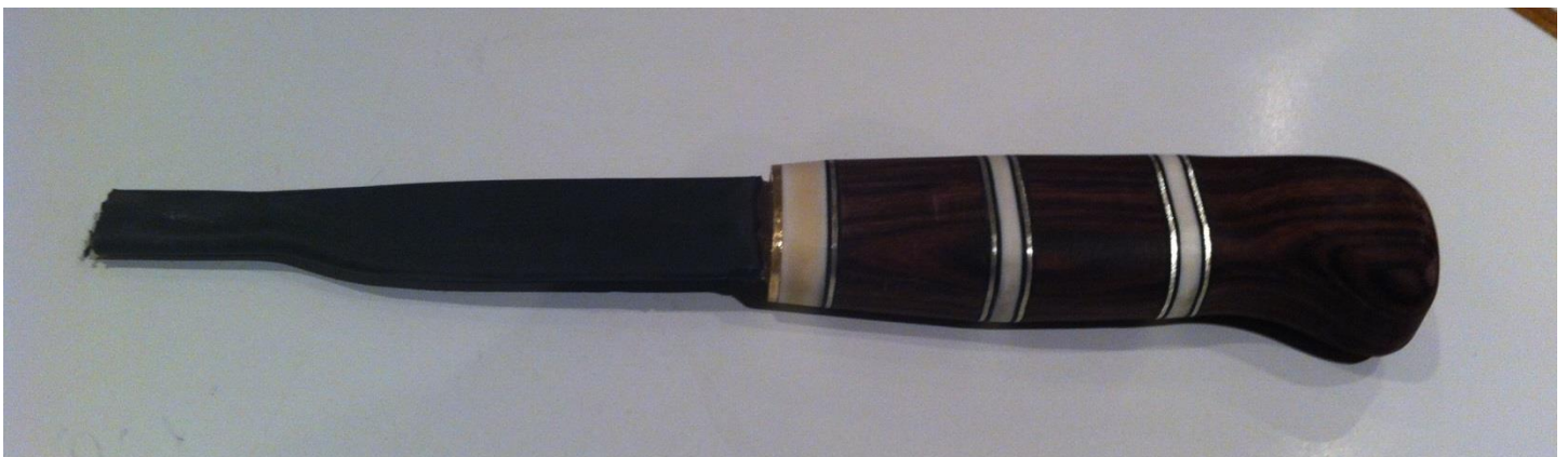
Kniven efter meget arbejde