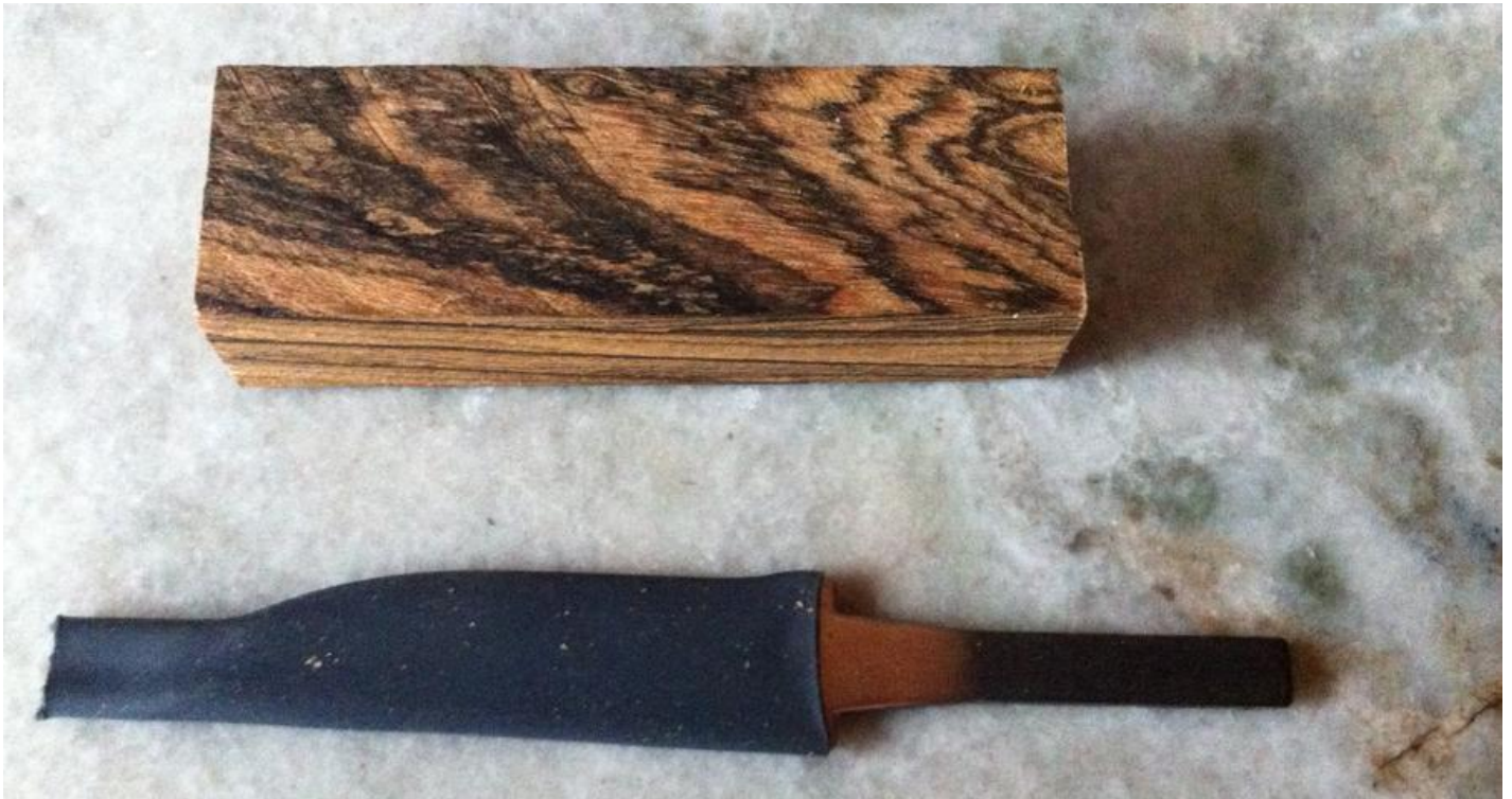
Nogle af materialerne til knivfremstilling