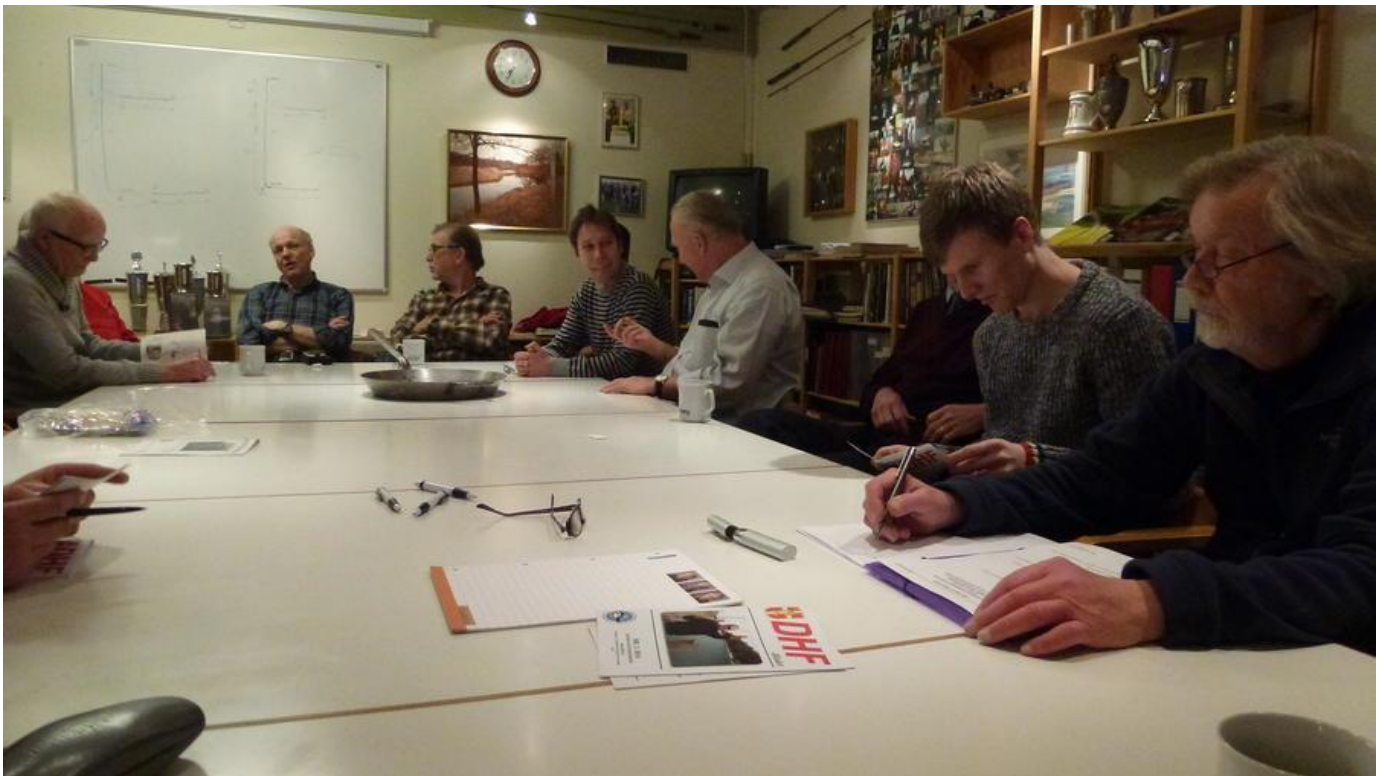
Udsnit af deltagerne på generalforsamlingen