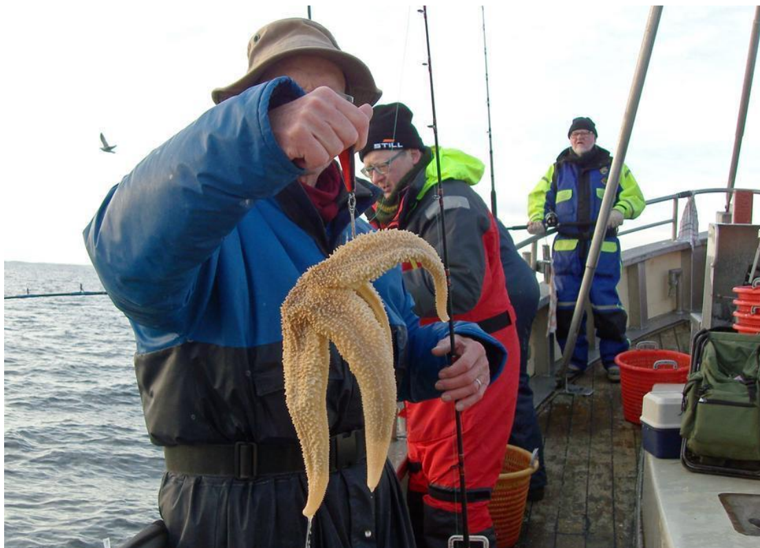
Ikke vinderkræet på Nytårsturen