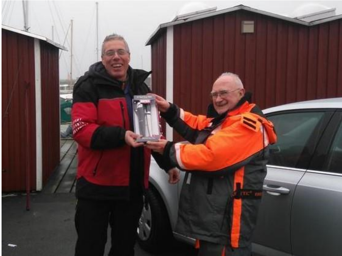
NYTÅRSTUREN SIDSTE TILMELDTE FISK-TORSK 1,2 KG