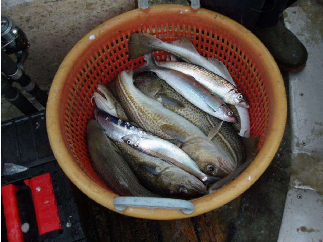
SÅDAN SÅ KURVENE UD VED NYTÅRSTUREN 2010