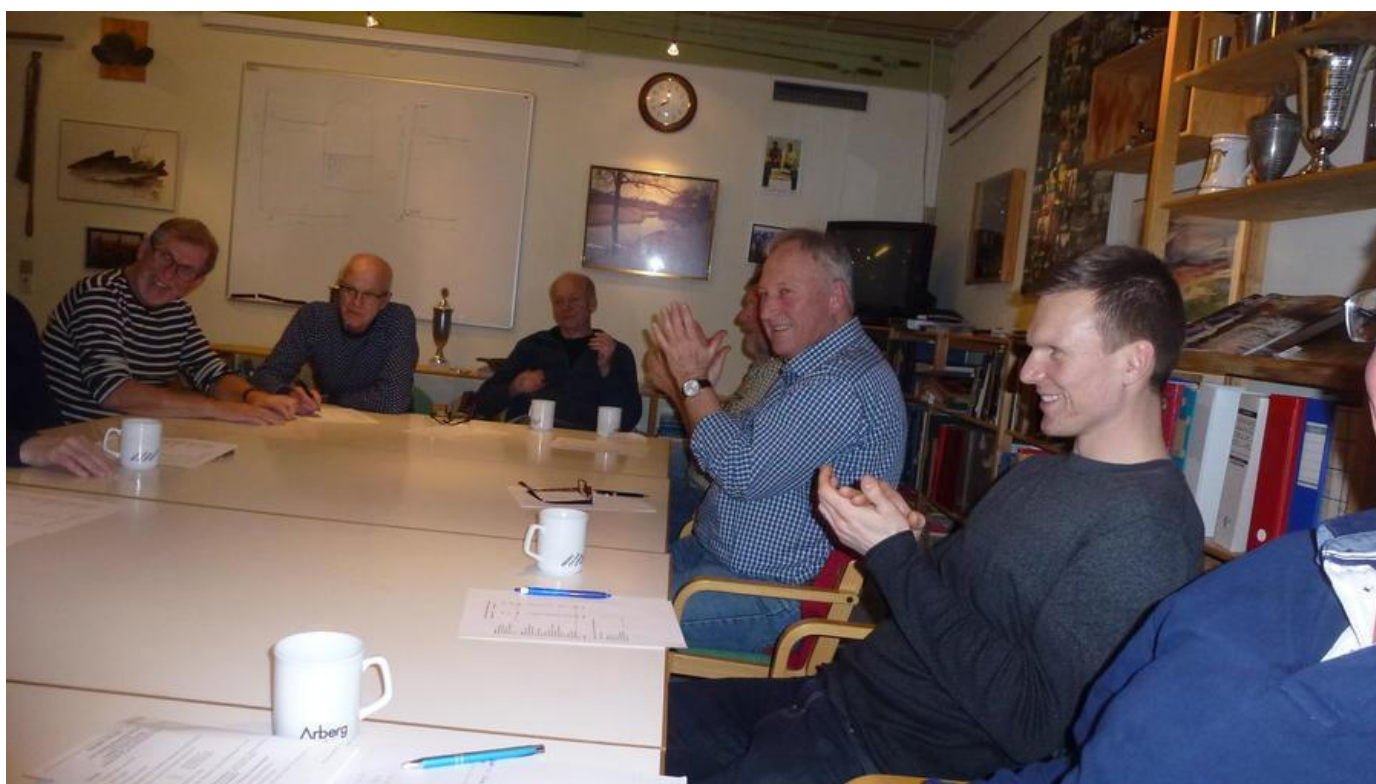
APPLAUS VED GENERALFORSAMLINGEN

Og så er der lige det med fangstrappoter. Send dem eller læg dem på hjemmesiden direkte. Pokaljagten for 2016 varer til 31. december.