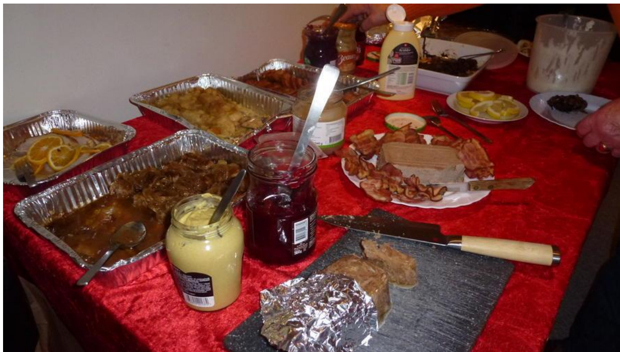
OPLÆG TIL JULEFROKOSTEN

Bestyrelsen arbejder konstant på at opnå rabatter og andre medlemsfordele hos grejforhandlere m.v. og har derfor lavet et medlemskort, så man overfor forretningerne kan demonstrere, at man er medlem af NEPTUN og dermed er berettiget til fordelene. Når vi har opnået medlemsfordele vil I blive orienteret pr. mail.