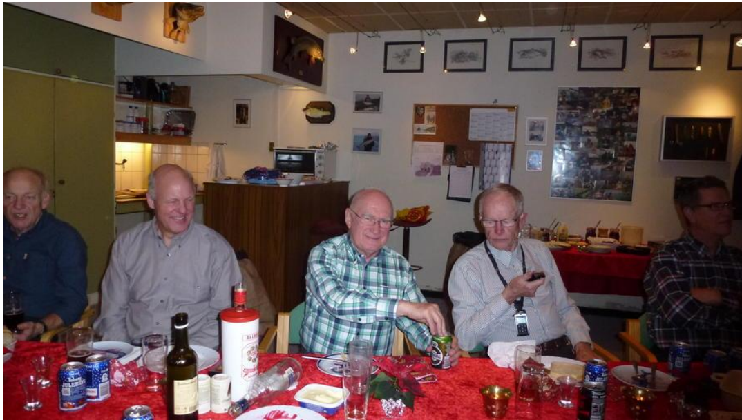
BENT SER LIDT BEKYMRET UD?