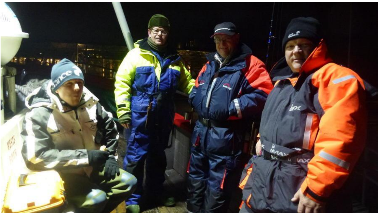
STORE FORVENTNINGER TIL BULETUREN