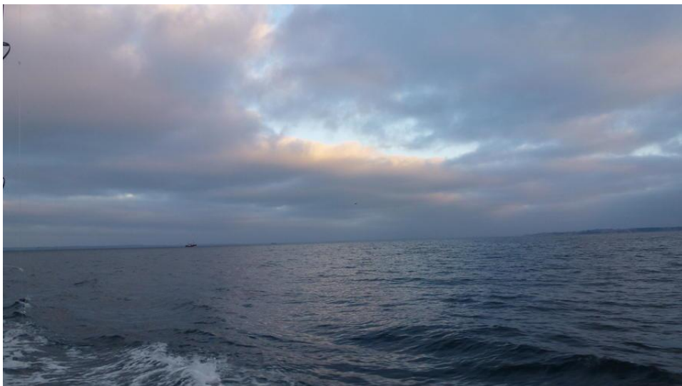
TIDLIGT PÅ DAGEN EFTER SILD OG TORSK