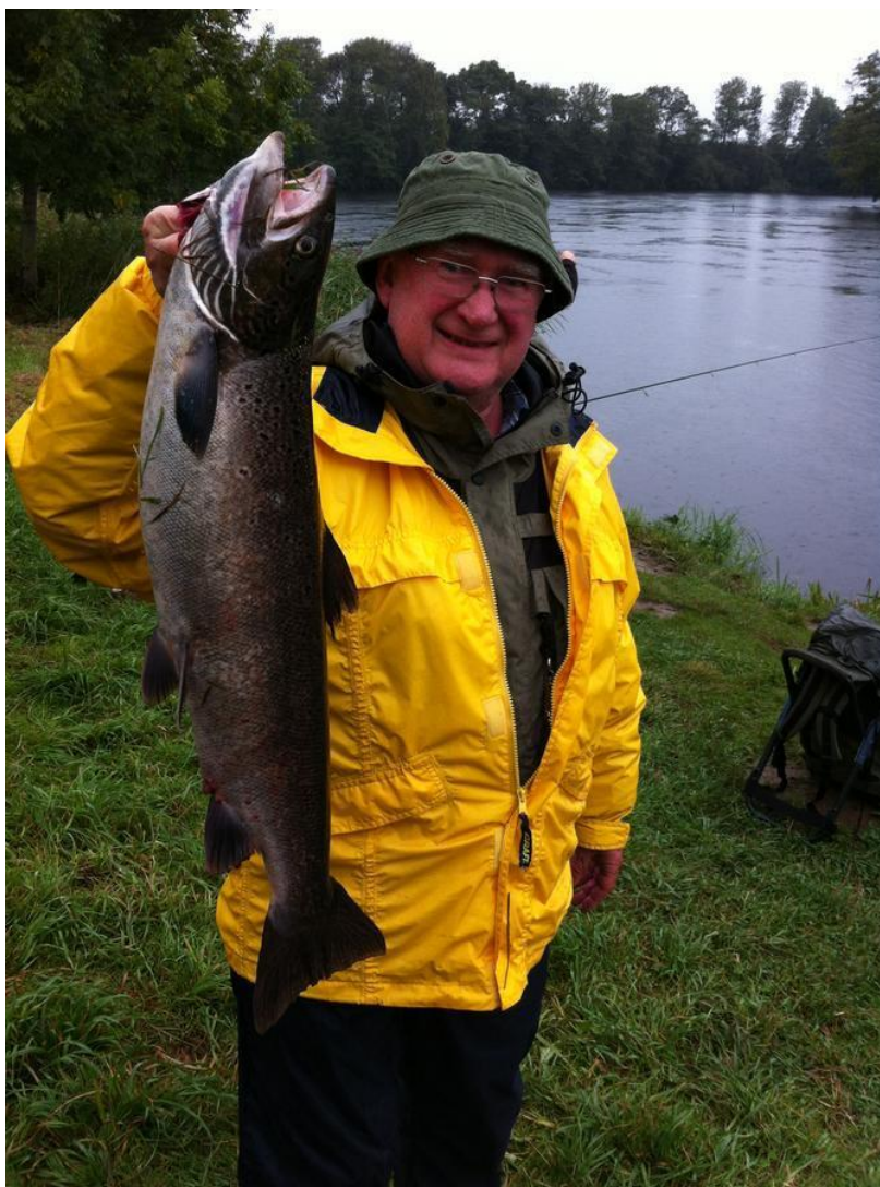
TRODS ALT FIK HENNING DOG 2 LAKS

Vores årlige klubtur til Lagan var i år udvidet til en hel uge fordi det ikke som tidligere var muligt at booke det hus vi har lejet de sidste 4 år, for kun fire dage. Det holdt dog ikke folk tilbage og turen var som tidligere "fully booked".