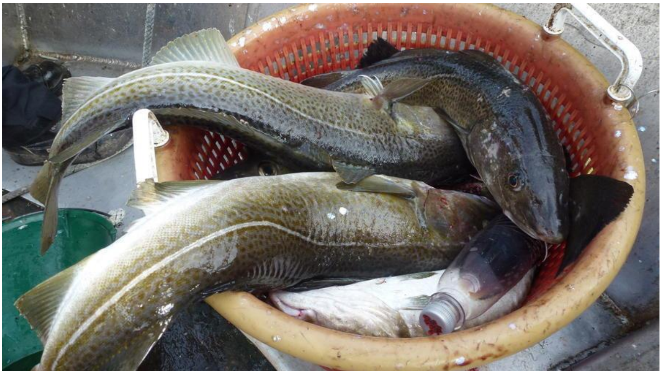
TORSK OG EN DRIKKEFLASKE