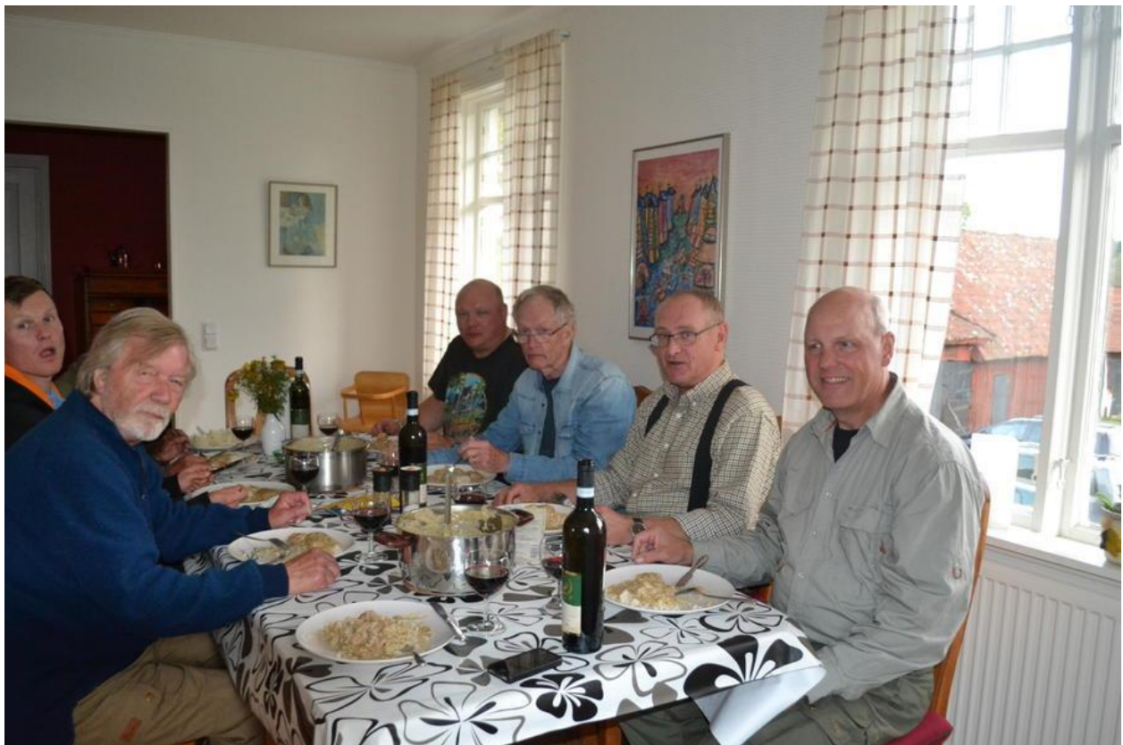
AFTENSMAD I LAGANHUSET

Bestyrelsen er bemyndiget til at forhøje kontingentet tilsvarende, hvis den eller de sammenslutninger m.v., som foreningen er tilknyttet, forhøjer deres kontingent.