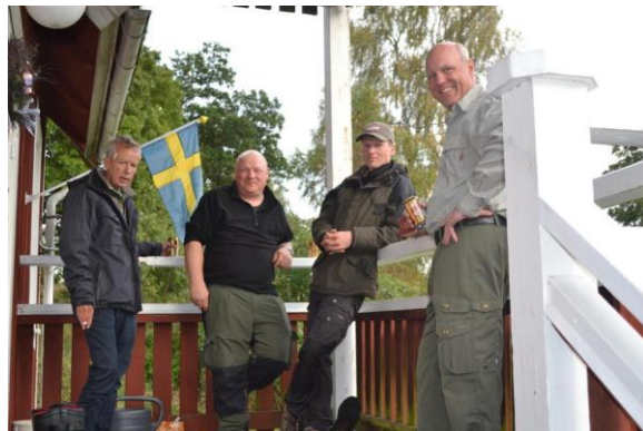
ET VIGTIGT TIDSPUNKT I LAGAN

Ret til ændringer i det trykte program forbeholdes.