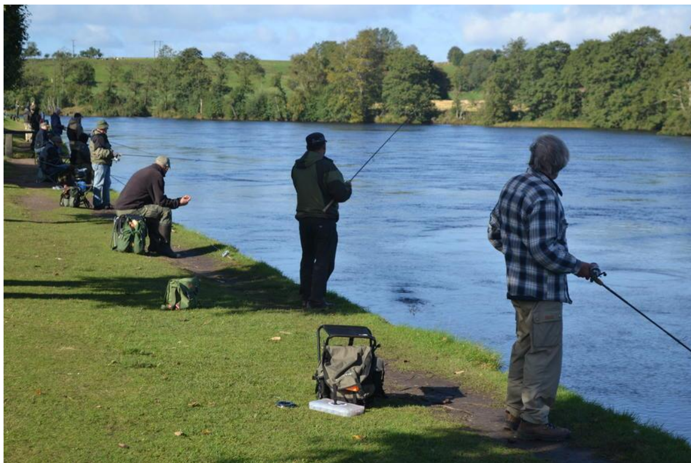
GRÖNNINGEN LAHOLM 2015