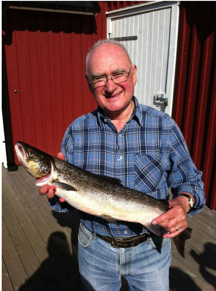
HELDIGE (DYGTIGE) HENNING I LAGAN