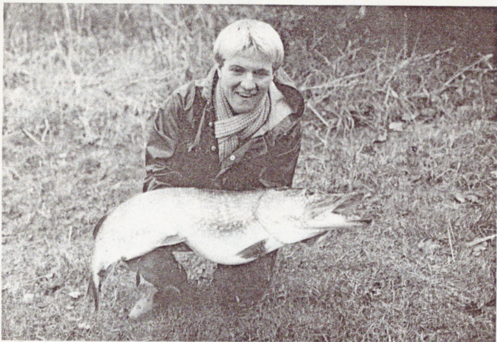
GEDDE 11,2 kg, 105 cm.