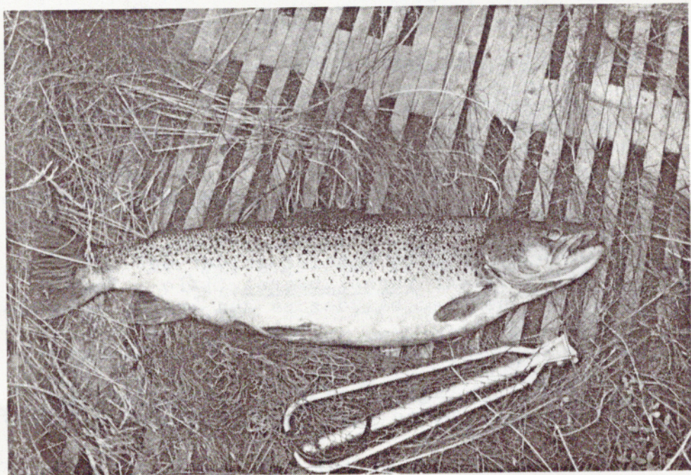
HAVØRRED 6,5 kg, 83 cm.