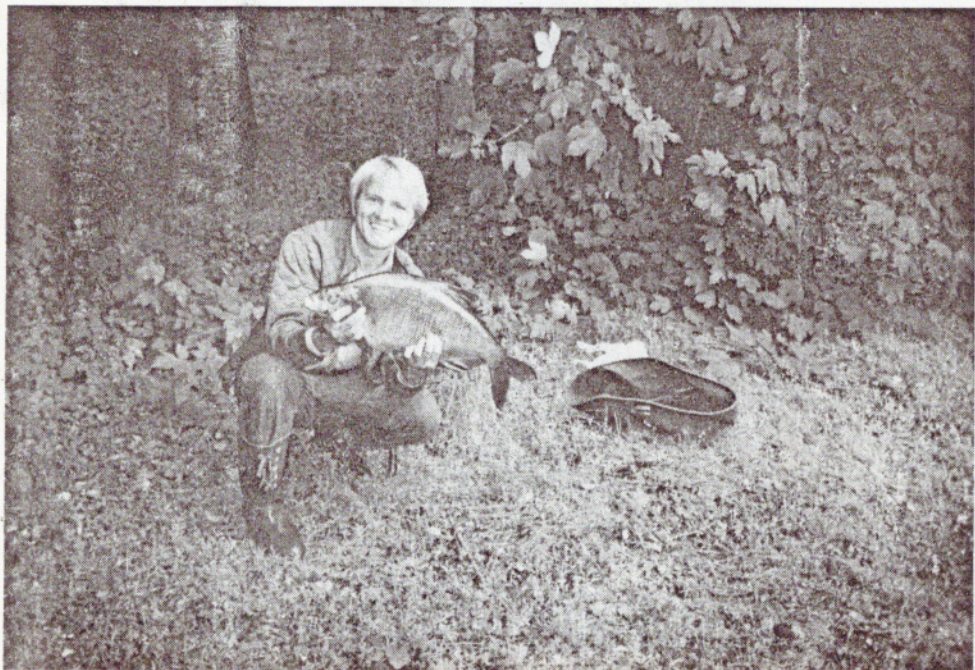
BRASEN 3,7 kg.