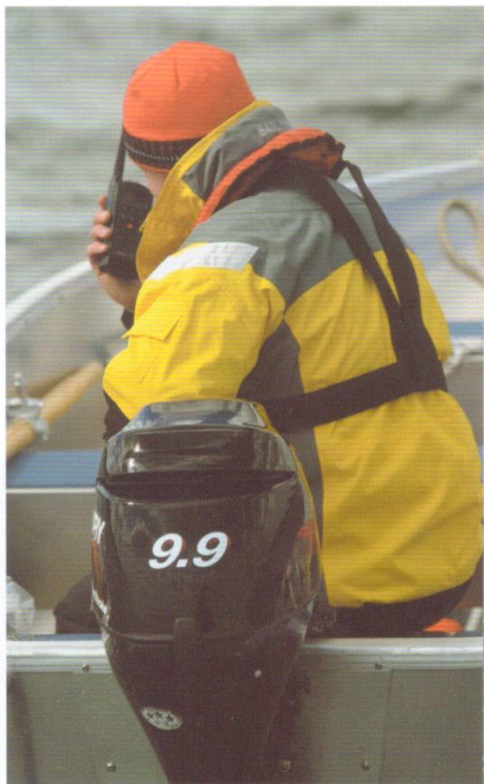
Check om speedbåds kørekort er påkrævet.

6. Sidst – men ikke mindst – når du har besluttet dig, så prøv jollen i vandet. Det er ikke lige så nødvendigt ved køb af nye joller, der er godkendt efter EU-normerne, som det er ved køb af brugte joller, men gør det alligevel. De fleste mennesker køber jo heller ikke ny privatbil uden først at køre en prøvetur.