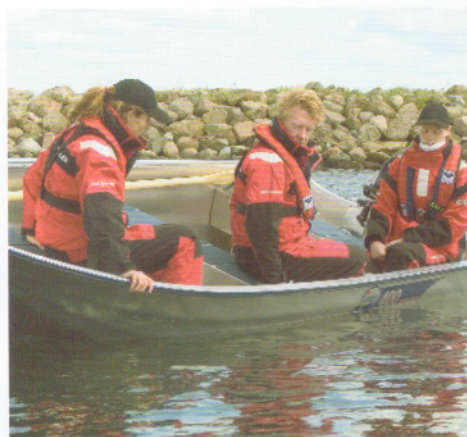
Afprøvelse af stabiliteten i en jolle.