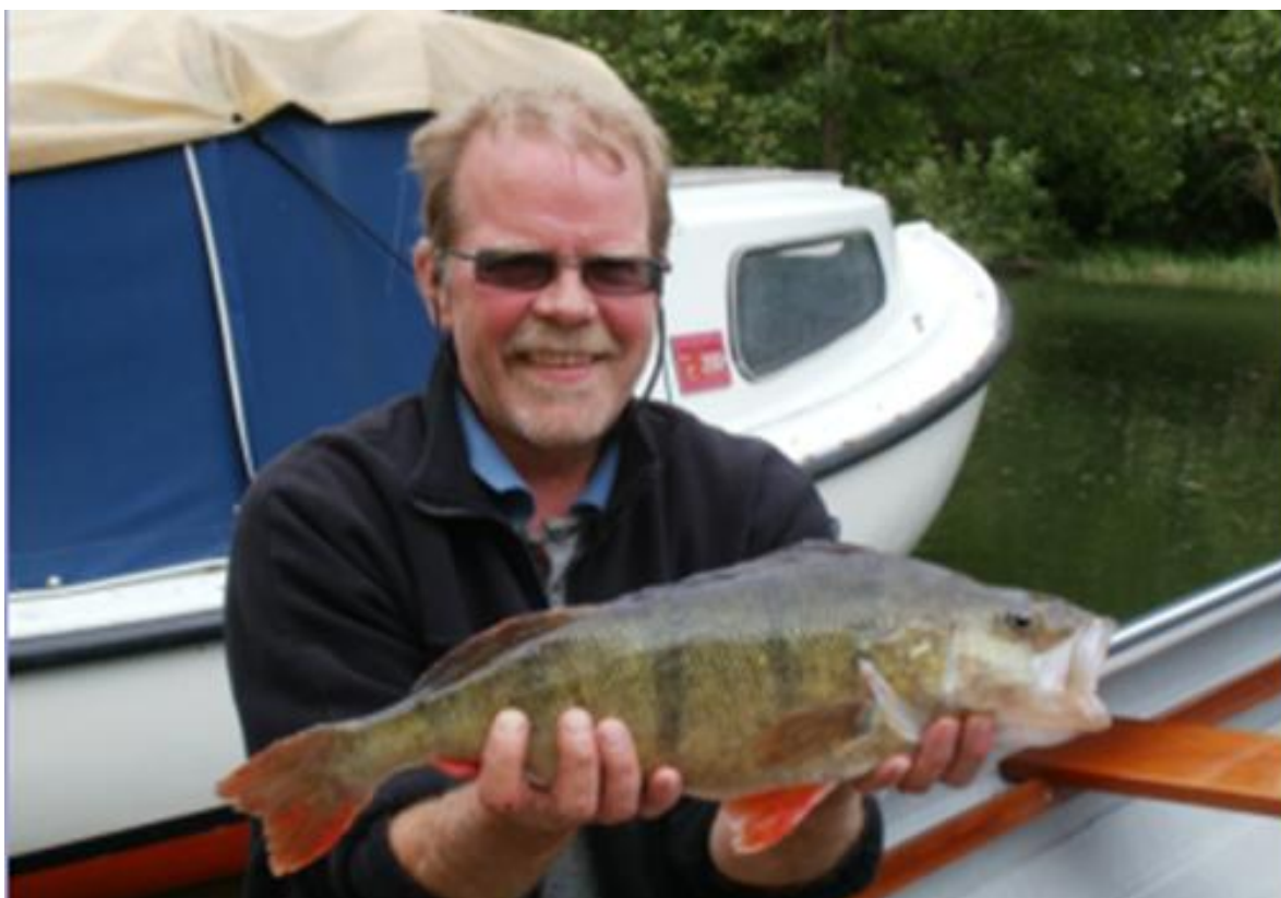
DAN MED FLOT ABORRE