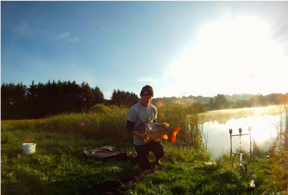
NICILAJ'S FLOTTE SPEJLKARPE