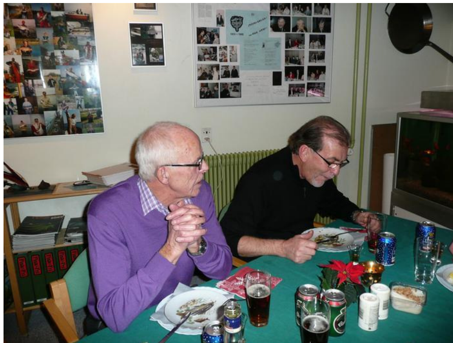
Hvad er det nu han spiser