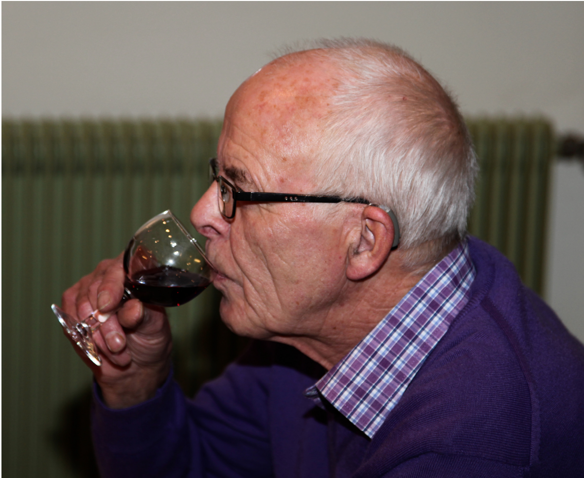
Han kan vist også godt lide vinen