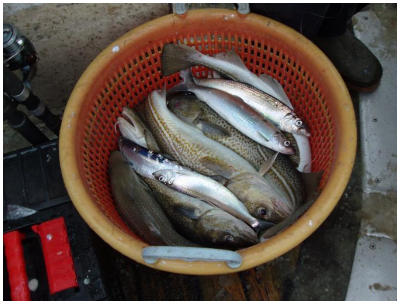
Torsk og store sild