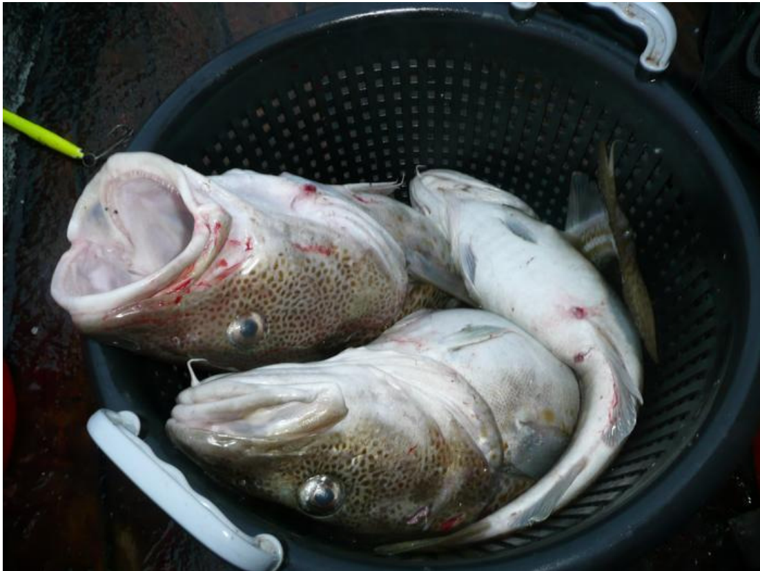
Samme tur sidste år