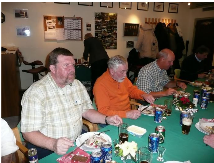
Er man koncentreret ellr ej?