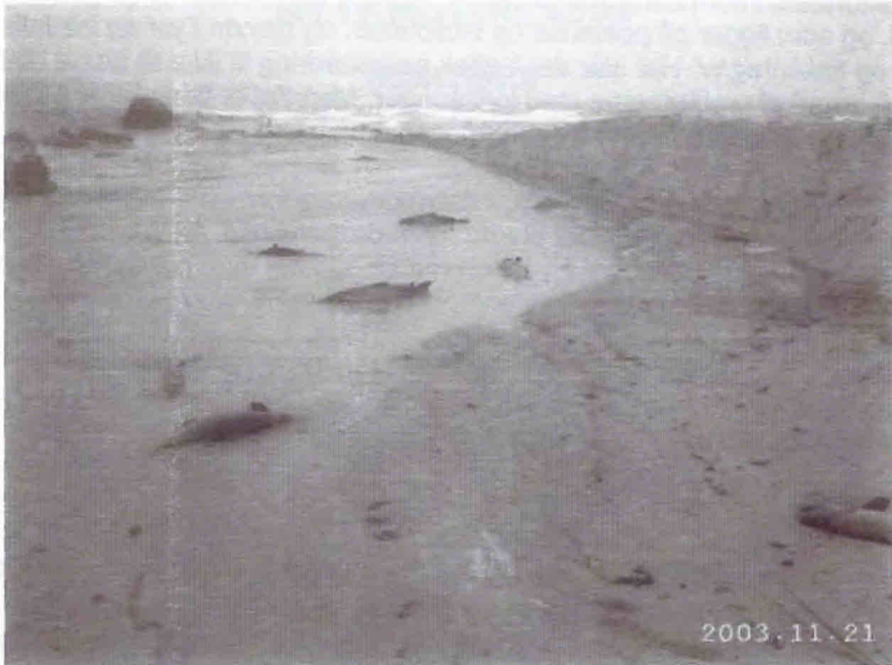
Ørredopgang i Blykøbbe å på Bornholm