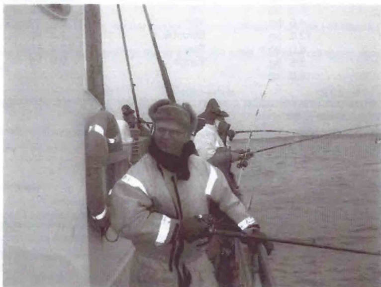
FRA ÅRETS TORSKETUR